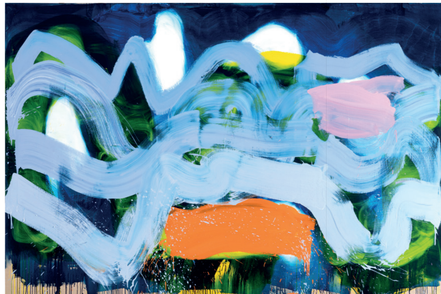
2 unten links, The Tempest 56, Öl auf Leinwand, 200 x 300 cm, 2021

Die Ausstellung ermöglicht das Erleben von effektvollen und dynamischen Farbräumen. Was zu Beginn noch als reine Abstraktion wahrgenommen wird, entpuppt sich bei intensiverer Betrachtung als abstrahierte Landschaft, die durch farbige Flächen, Streifen, Linien und mäandernde Bänder komponiert ist. Bei dem zentralen Gemälde Window to the Sea (Covermotiv) eröffnet beispielsweise ein gemalter weißer Rahmen den Blick wie durch ein Fenster auf schäumende Wellen vor blauem Meeresgrund und pinkem Horizont. Es ist das südliche Gefilde einer lichtdurchflutenden Küste im Morgen- oder Abendrot, das