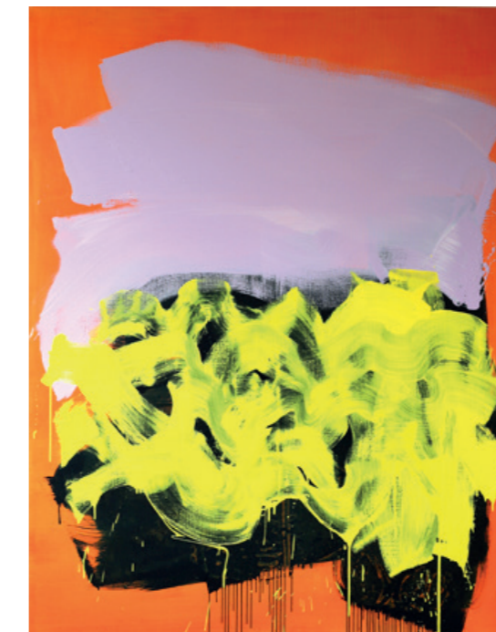
3 oben rechts, Día de Verano, Öl auf Leinwand, 180 x 140 cm, 2022

die Künstlerin hier auf die Leinwand bannt. Die Seelandschaft ist im stetigen Wandel. Das Meer, der Himmel, der Strand und das Licht ändern sich permanent.